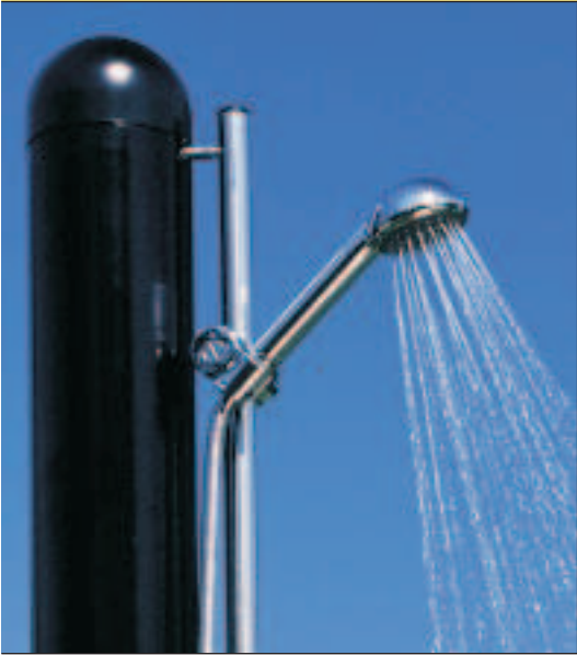
Modell 39 Dusche SUMATRA